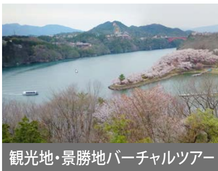
観光地・景勝地バーチャルツアー