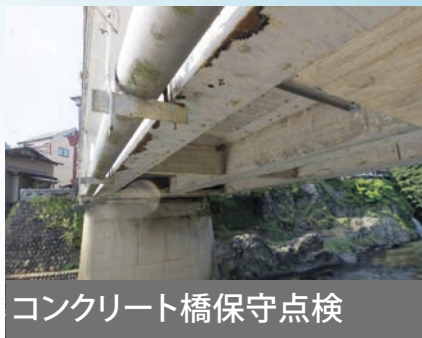
コンクリート橋保守点検