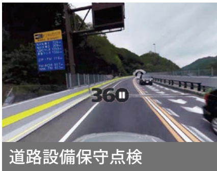
道路設備保守点検