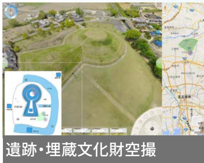
遺跡・埋蔵文化財空撮