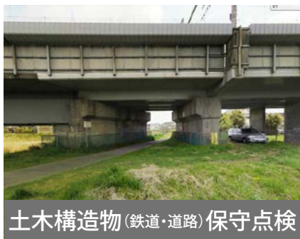
土木構造物(鉄道・道路)保守点検